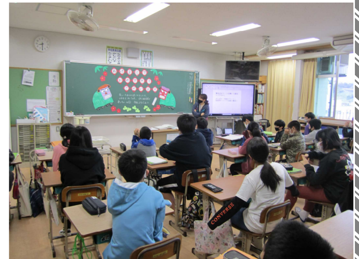
（他の学級も色とりどり。全部紹介したいくらいです）

1月6日、コロナ感染等の報告は1人もなく、座安っ子が無事、帰ってきました。先生方は黒板に色とりどりの新年の飾り付けをして子ども達を迎えます。先生方の愛情を感じます。登校の時は冬休みの疲れ？なのかなんだか元気がないようにも見えましたが、学級で担任の先生と新年のあいさつをする、元気な声が教室中から響きます。先生方にとっても、元気になり、一陽来復な一年にするやる気へとつながったことでしょう。