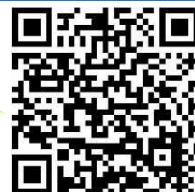
陽性者登録センターHP