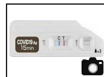
添付イメージ（判定ライン）