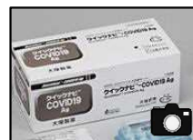
添付イメージ（製品名）